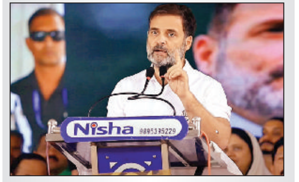
मुंबई हलचल / मलप्पुरम

कांग्रेस सांसद राहुल गांधी ने केरल के मलप्पुरम में पीएम मोदी पर तंज कसा है। उन्होंने कहा कि मैं इस दुविधा में हूँ कि वायनाड या रायबरेली किससे सांसद बना रहूँ? उन्हें भगवान से कोई निर्देश नहीं मिलता कि क्या करना है, जैसा कि प्रधानमंत्री करते हैं। मेरे पास इस तरह की कोई भी सुविधा नहीं है और भगवान मुझे कोई आदेश नहीं देते हैं। पीएम मोदी ने हाल ही में एक इंटरव्यू के दौरान बताया कि वे थकते क्यों नहीं हैं। पीएम मोदी ने कहा कि पहले जब तक मां जिंदा थी मुझे लगता था की शायद जैविक रूप से मुझे जन्म दिया गया है। मां के जाने के बाद सारे अनुभव को मैं जोड़ कर देखता हूँ तो मैं कन्विंस हो चूका हूँ कि परमात्मा ने मुझे भेजा है।